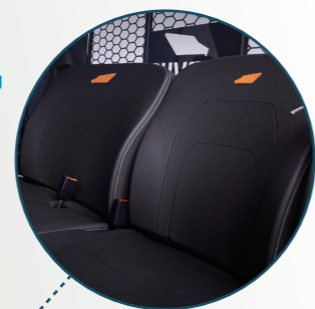
Sedile appaiato regolabile

Terrain EX4 è un veicolo utilitario tuttoterreno (UTV) elettrico che risponde perfettamente alle esigenze di qualsiasi giorno di lavoro. Dotato di tutta la capacità OFF-ROAD Terrain, può percorrere fino a 100 km con una sola ricarica e tutta la potenza necessaria per la tua giornata.