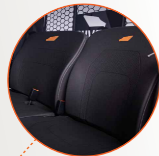
Sedile appaiato regolabile

Terrain DX4 è un potente e robusto veicolo diesel 4x4 con grande capacità di stivaggio e di carico. Una macchina da lavoro disegnata per far fronte alle condizioni più dure.